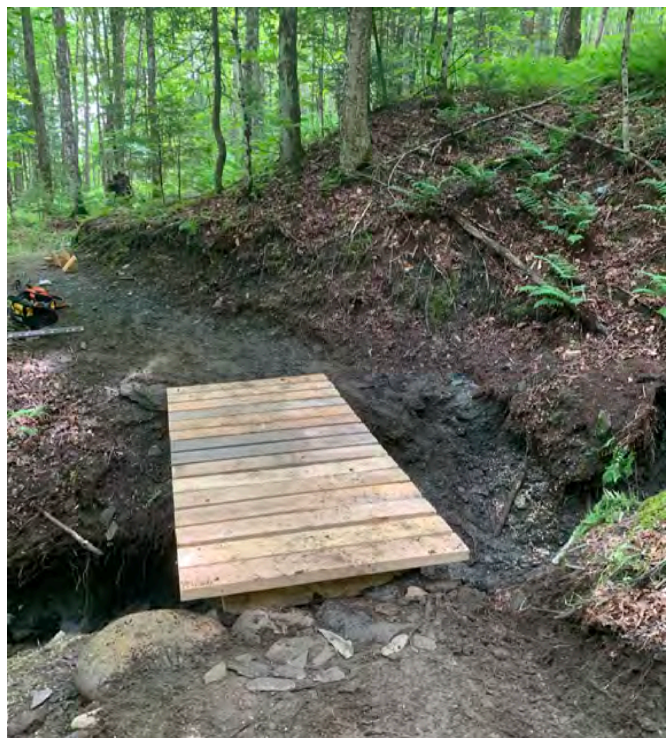
Figure 11 : Passerelle ajoutée