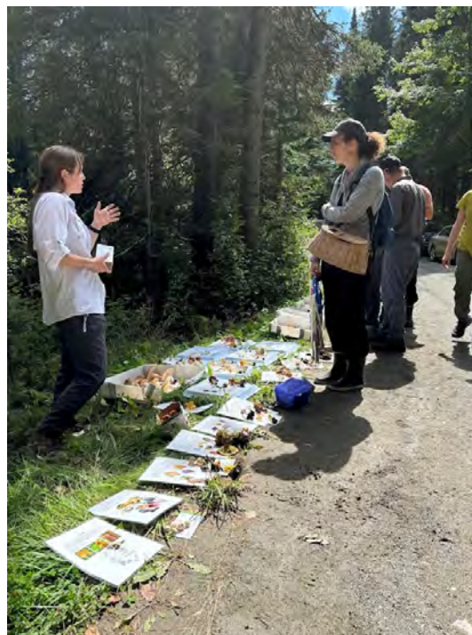
Figure 12 : Sortie des Mycologues de l'Estrie