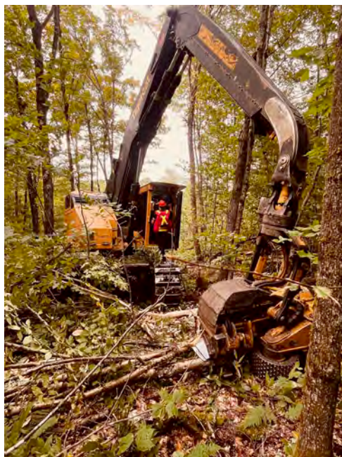
Figure 13 : Travaux de restauration forestière réalisés par le Groupement forestier des Cantons visant la régénération du bouleau jaune, Chantier Sam's, Août 2024

La restauration forestière est à la base de la mission de Forêt Hereford. Cette année encore, ces travaux ont fortement été affectés par les conditions météorologiques, et ce pour une deuxième année d'affilée. Après l'année 2023, durant laquelle notre territoire avait reçu deux fois plus de pluie qu'en 2022, les tempêtes Bérlyl et Debby ont contribué à fragiliser les sols. Les travaux de restauration forestière ont débuté à la mi-août, à la faveur d'un temps plus sec. Les travaux d'hiver ont eu lieu normalement de décembre 2024 à mars 2025, sous des conditions variables. Les nombreuses modifications à la planification ont été justifiées par les conditions du marché, les impacts routiers de la tempête Bérlyl et la nécessité d'augmenter le volume récolté afin d'avoir les liquidités nécessaires aux réparations de chemins forestiers à la suite de Bérlyl.