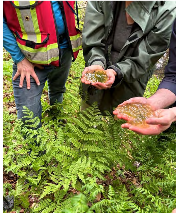
Figure 1 : Œufs d'amphibiens dans un milieu humide de la Forêt Hereford, Mai 2024