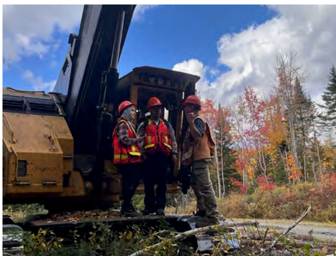
Figure 15 : Visite de chantier par les étudiants-chercheurs dans le nouveau dispositif de recherche de l'Université Laval, Chantier Slouce, octobre 2024).