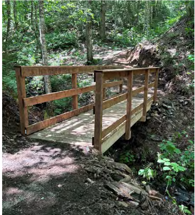
Figure 9 : Nouvelle passerelle

A la suite de la tempête Béril, la fermeture temporaire des sentiers s'est avérée nécessaire : ponts arrachés, passages à gué impraticables. Tout a été rétabli en une semaine grâce au travail de notre responsable de l'entretien. Au cours de la saison, 3 passerelles ont été ajoutées, un pont a été rebâti avec de nouvelles assises, des garde-corps ont été ajoutés sur 2 passerelles.