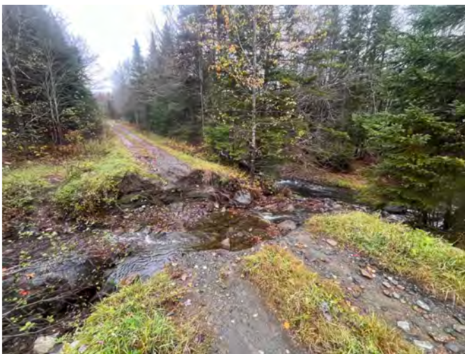
Figures 3 et 4 : Bris chemin de la Prairie

Forêt Hereford a bénéficié d'une aide financière de 47 606$ du ministère de la Sécurité publique pour financer une portion de ces réparations.