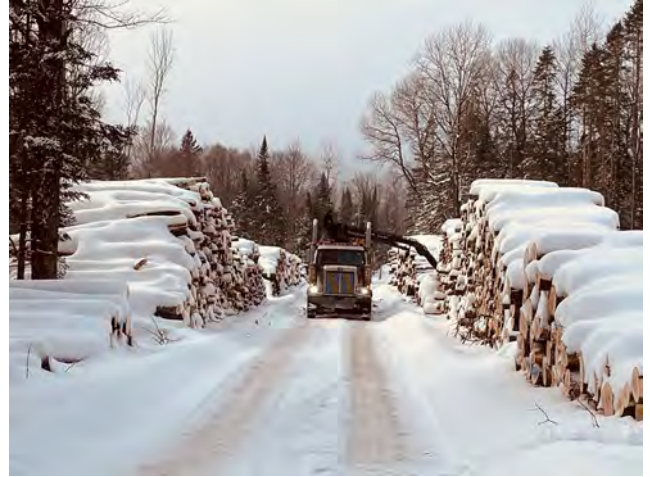
Figure 14 : Chargement de bois au chantier du chemin Owen en janvier 2025

Les travaux hivernaux ont été réalisés dans une aire de confinement du cerf de Virginie dans le chemin Owen. Des modalités y avaient été développées afin de protéger la qualité de l'habitat hivernal du cerf (notamment avec la protection de 5 % du secteur afin de maintenir des îlots de repos identifiés).