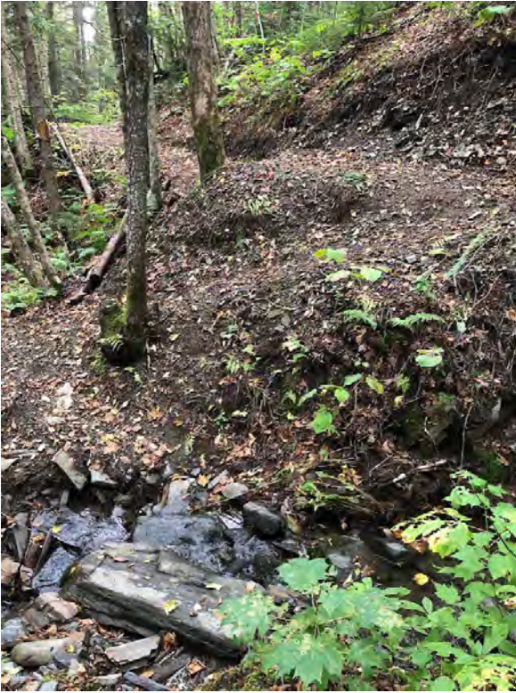
Figure 8 : Passage à gué - avant