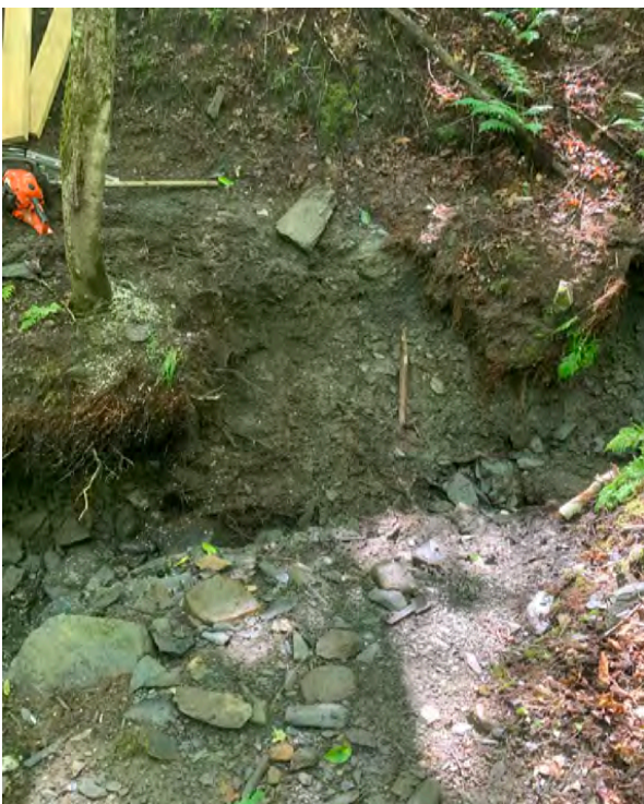
Figure 10 : Passage à gué brisé par Béril

A la suite de la tempête Béril, la fermeture temporaire des sentiers s'est avérée nécessaire : ponts arrachés, passages à gué impraticables. Tout a été rétabli en une semaine grâce au travail de notre responsable de l'entretien. Au cours de la saison, 3 passerelles ont été ajoutées, un pont a été rebâti avec de nouvelles assises, des garde-corps ont été ajoutés sur 2 passerelles.