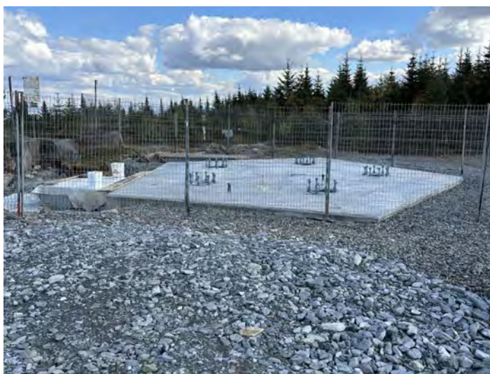
Figure 7 : Base de la tour au sommet

La campagne de financement a connu un franc succès, les 80 marches et les 5 terrasses ont été adoptées.