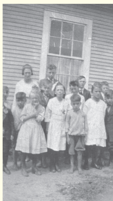
La classe / The class Vers / circa 1917-1918