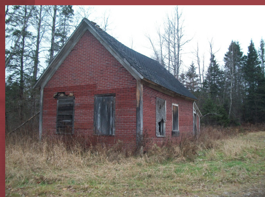
La petite école en / in 2014