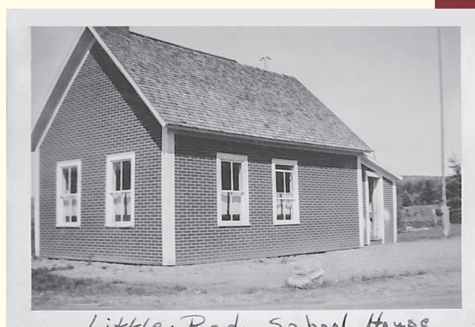
Little Red School House vers / circa 1949

Schoolhouses, with one-room multi-grade class, wood-burning stoves and women schoolteachers, have left an indelible mark on the history of rural Quebec. These small schools, built every one or two miles, taught generations of children, who were forced to "walk two miles to school, in the snow, uphill both ways!"