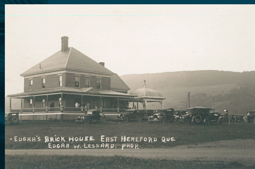
Brick House

Dans le canton de Hereford, l'eau coule dans les deux sens : certaines rivières rejoignent le bassin versant du Saint-Laurent et d'autres, le fleuve Connecticut et l'océan Atlantique.