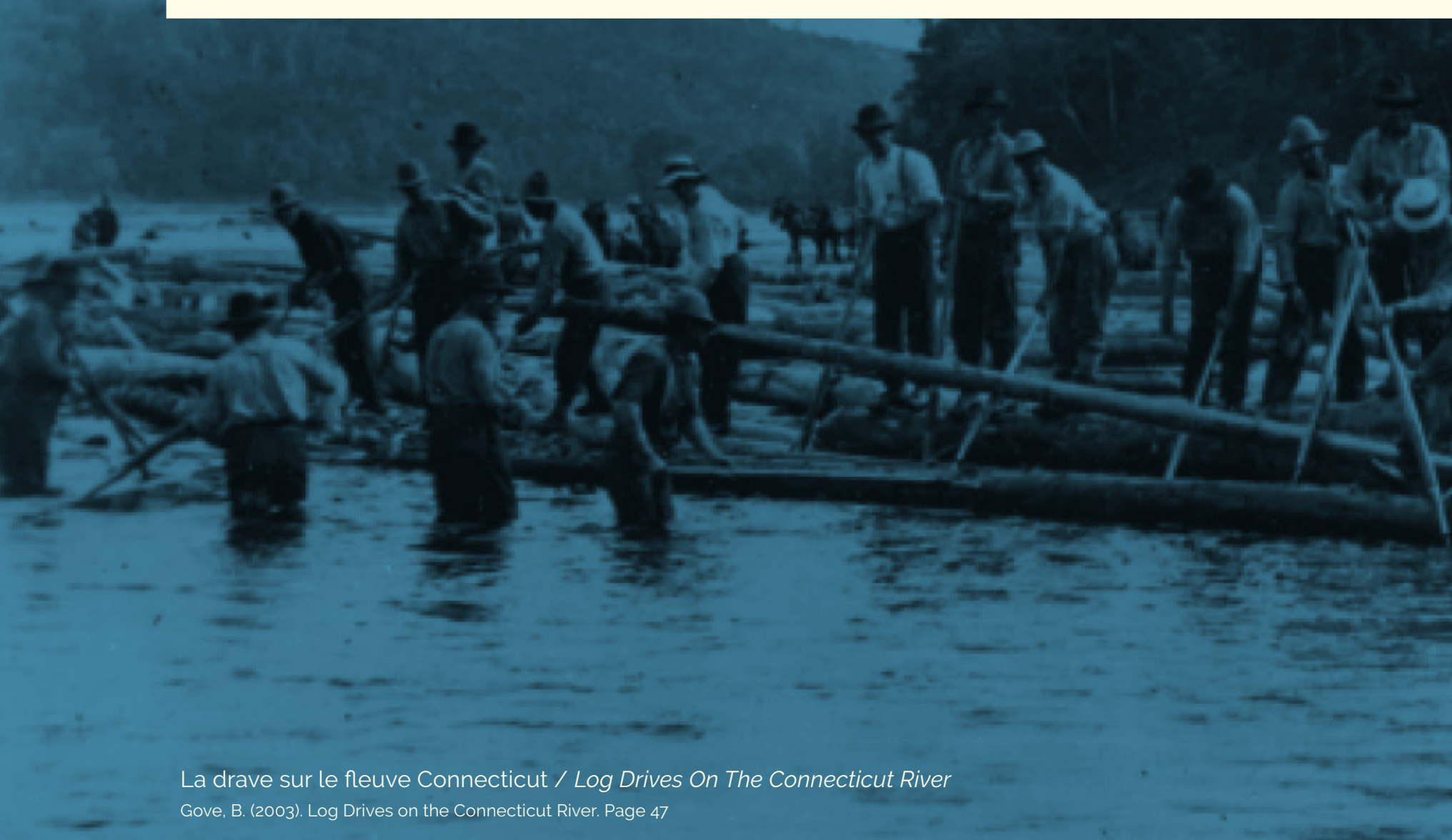
La drave sur le fleuve Connecticut / Log Drives On The Connecticut River Gove, B. (2003). Log Drives on the Connecticut River. Page 47