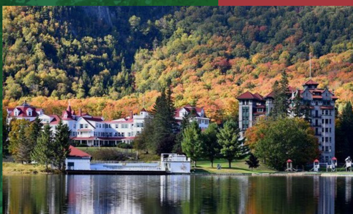
The Balsams Grand Resort Hotel, 2019