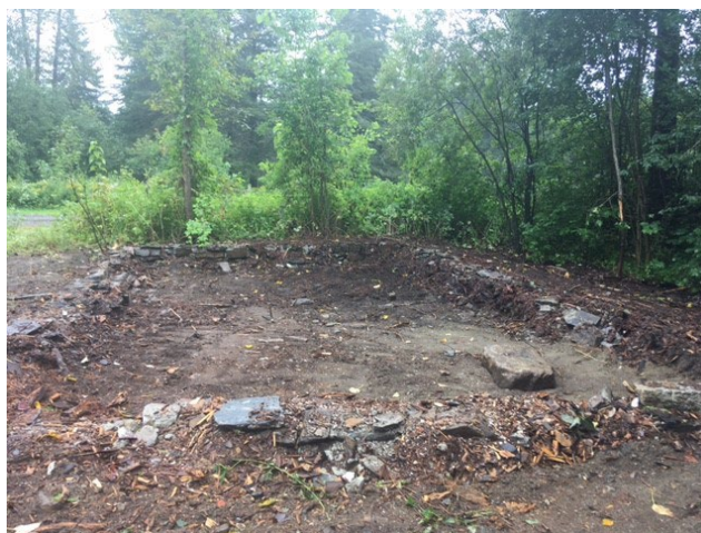
Figure 4 : Fondation École Andrews (Août 2022)

La fondation a été préservée afin d'en conserver une trace.