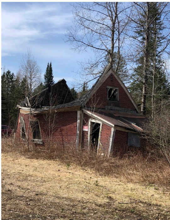
Figure 3 : École Andrews (Avril 2022)

En raison de l'état de dégradation de la l'école Andrews sur le chemin Owen (Voir Figure 3), la décision a été prise de procéder à sa démolition et au transport des matériaux à un site de récupération des CRD (construction/rénovation/démolition).