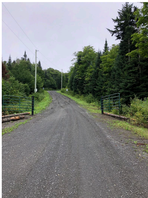
Figure 6 : Barrière chemin Centennial

Une deuxième barrière a été installée sur le chemin Centennial après le stationnement afin de permettre de restreindre l'accès au sommet tout en conservant l'accès aux sentiers. Diverses raisons ont mené à cette décision :