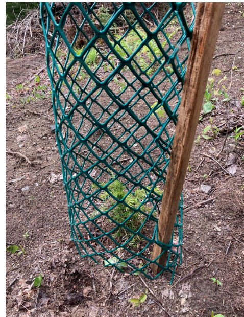
Figure 7. Plant de pruche du Canada avec protecteur, dans la Forêt Hereford (mai 2022)

Ces travaux ont été réalisés grâce à l'implication de l'équipe du Groupement forestier des Cantons et de nombreux autres collaborateurs dont la Fiducie de recherche sur la Forêt des Cantons-de-l'Est, l'Agence de forêt privée de l'Estrie, la Scierie Lauzon et la Scierie Champeau.