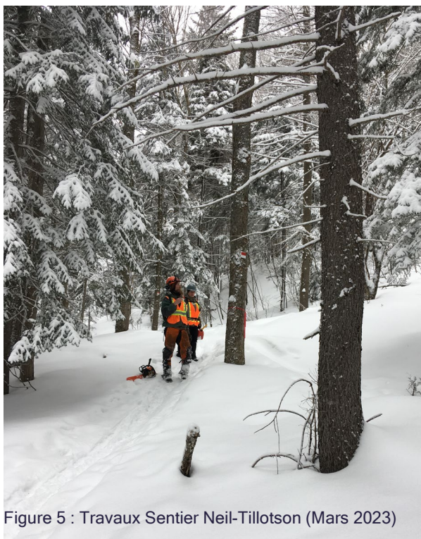
Figure 5 : Travaux Sentier Neil-Tillotson (Mars 2023)