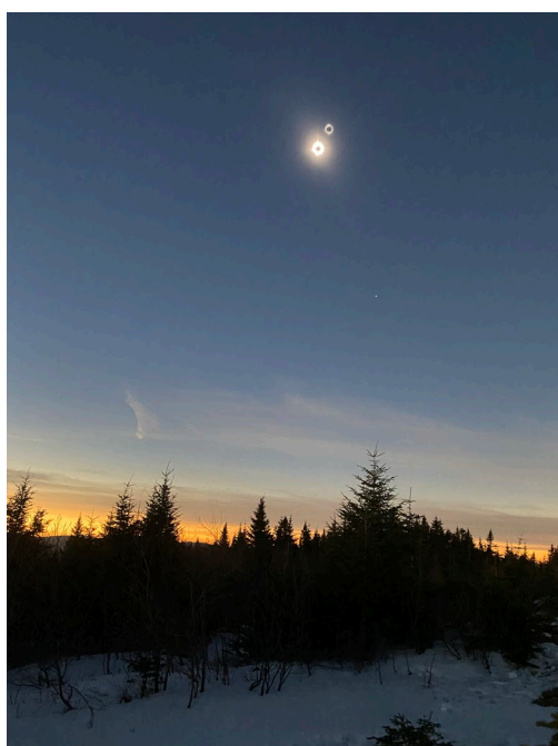
Figure 6 : Éclipse solaire vue du sommet

Le chantier de construction s'échelonnait du 25 juin à la mi-septembre 2024. Pendant cette période l'accès au sommet sera fermé sur semaine.