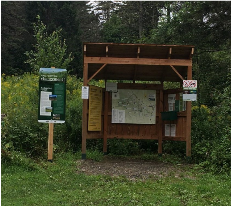
Figure 9 : Panneau d'information sur les travaux forestiers de l'hiver 2024 installé au stationnement de vélo de montagne du chemin Houle (East Hereford en août 2023).

une plantation d'épinettes blanches dans le secteur de sentier de vélo de montagne au chemin Houle, tandis que le reste était en coupes partielles. Une stratégie de communication avait d'ailleurs été mise en place pour les cyclistes concernant les travaux à proximité des sentiers de vélo au chemin Houle. Des vidéos ont notamment été mis en ligne dans la page Facebook de Forêt Hereford et un panneau d'information a été installé en août 2023, plusieurs mois avant les travaux forestiers.