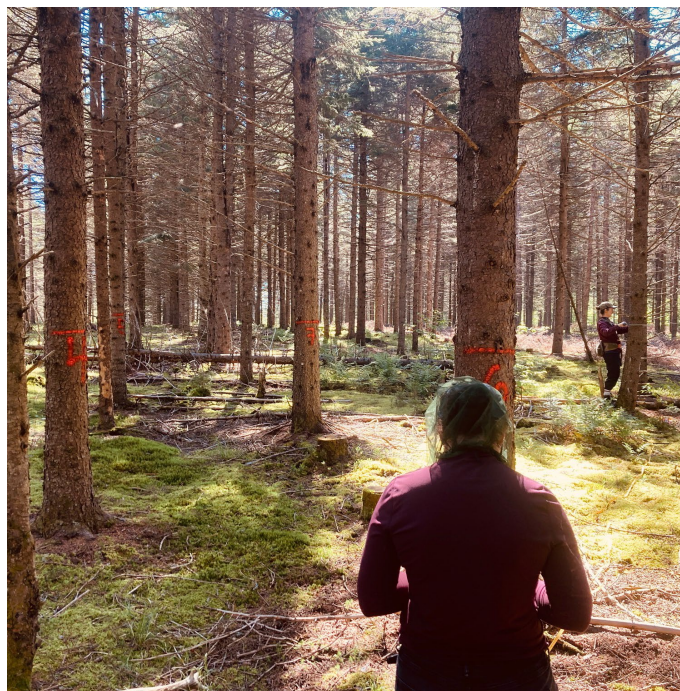
Figure 10 : implantation d'un dispositif de suivi expérimental au chemin des Castors (juillet 2023).

La première vérification du Projet forestier Pivot s'est poursuivie en 2023-2024. Elle sera terminée en 2024 et ces délais sont principalement dus au délai chez Verra, l'organisation qui gère le standard VCS.