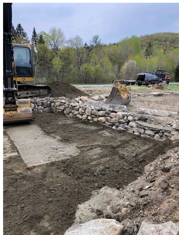
Figure 3 : Fondations 15 mai 2023

La fondation a été préservée et remblayée pour des raisons de sécurité. Ce site pourra faire l'objet d'une mise en valeur dans les années futures.