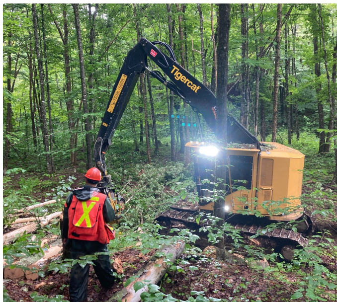
Figure 8 : Chantier du chemin Albert au moment de la suspension complète des travaux en août 2023.

La restauration forestière est à la base de la mission de Forêt Hereford. Cette année, ces travaux ont fortement été affectés par les conditions météorologiques. Notre territoire a reçu deux fois plus de pluie en été que lors de l'année 2022. Les travaux forestiers de l'été 2023 n'ont duré que 9 jours et ont été suspendus compte tenu de la fragilité des sols. Les travaux d'hiver ont eu lieu normalement en janvier et en février 2024. Environ 50 % des travaux de restauration forestière prévus ont ainsi pu être réalisés. L'année précédente, c'est seulement 30 % de la planification qui avait pu être réalisée (pénurie d'entrepreneurs forestiers).