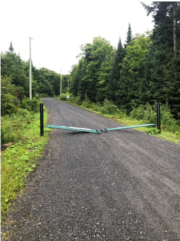
Figure 4 : Barrière chemin Centennial 13 août 2023

Au cours de la dernière année, une réparation majeure y a été effectuée afin de sécuriser un secteur plus fragile, mais ce sont les conditions météo et les fortes pluies qui ont parfois obligé la fermeture de ce chemin.