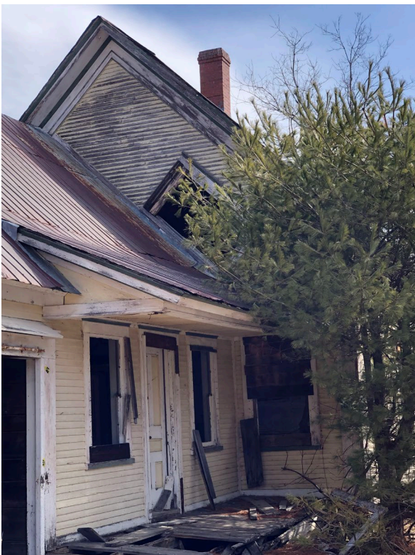
Figure 2 : Maison jaune - 21 mai 2022

A la suite d'une expertise réalisée sur la structure, la maison jaune la décision a été prise de procéder à sa démolition et au transport des matériaux à un site de récupération des CRD (construction/rénovation/démolition).