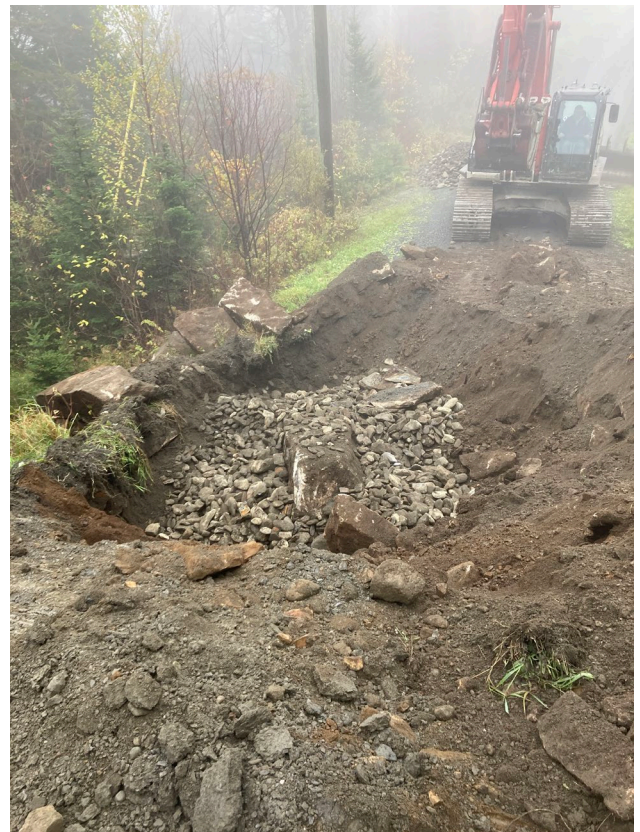
Figure 5 : Réparation Centennial 15 octobre 2023

Également, lors d'activité au sommet et lors de périodes de fort achalandage de nuit, la barrière située après le stationnement bloque l'accès en voiture pour permettre aux utilisateurs d'accéder au sommet en sécurité soit une randonnée de 2 kilomètres par le chemin.