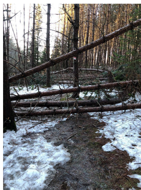
Figure 7 : Sentier Neil-Tillotson 2024

En décembre, le secteur de la pinède du sentier Neil-Tillotson a connu un épisode de chablis versant une cinquantaine de pins rouges et de pins blancs laissant une trace qui sera visible pendant de nombreuses années.