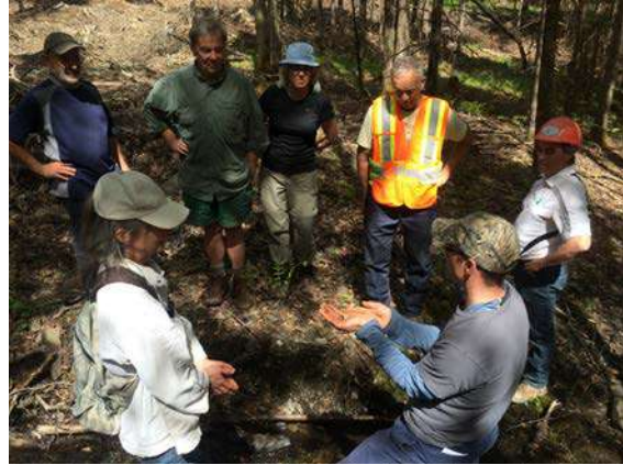
Figure 4 : Visite de travaux de restauration forestière en mai 2016 avec les membres du conseil d'administration et des deux Tables consultatives de Forêt Hereford.

Tant les membres des deux Tables que du conseil d'administration ont été invités à une sortie terrain, en mai 2016, afin de visiter des travaux de restauration forestière et des sentiers récréatifs (figure 4).