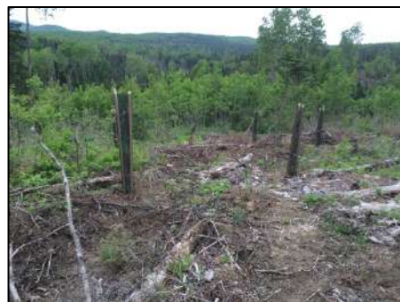
Figure 11 : Enrichissement de tilleuls et chênes, protégés après la mise en terre en mai 2016.

L'année 2016-2017 a été marquée par le début de deux approches importantes en matière de restauration forestière. En effet, pour la première fois, Forêt Hereford et son conseiller forestier, AFA des Sommets, ont procédé à l'enrichissement forestier avec des espèces d'arbres aujourd'hui pratiquement disparues du paysage forestier de la Forêt communautaire. Ainsi, près de 400 chênes rouges et tilleuls d'Amérique, parsemés de près de 2 500 pins blancs, épinettes rouges et épinettes blanches, ont été mis en terre au mois de mai 2016, dans d'anciennes friches forestières où ces espèces étaient auparavant présentes (figure 11). De plus, afin d'assurer le plus de chance de