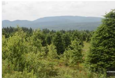
Forêt Hereford demande officiellement à Hydro-Québec d'enfouir la portion de sa future ligne électrique qui doit traverser la forêt communautaire Hereford.