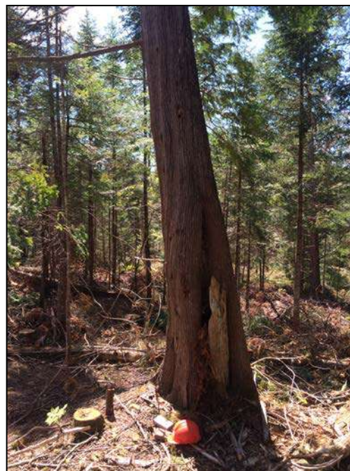
Figure 3 : Gros arbre, attribut de vieille forêt, conservé lors des travaux d'aménagement forestier de l'été 2016.