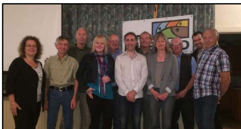
Figure 1 : Membres du conseil d'administration et direction de Forêt Hereford inc. (21 juin 2016)