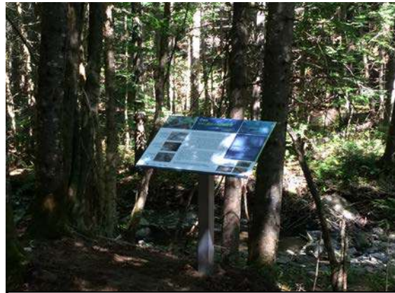
Figure 6 : Nouveau panneau d'interprétation installé en 2016 dans le sentier de la Chute à Donat.