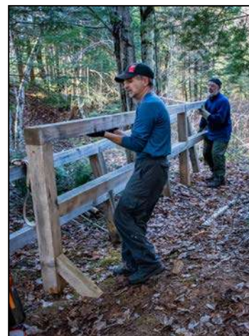
Figure 7 : Corvée bénévole dans les sentiers pédestres à l'automne 2016