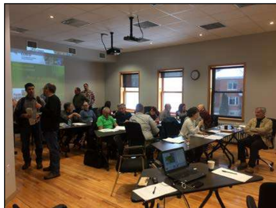
Figure 5 : Rencontre du comité consultatif concernant la planification intégrée et le zonage fonctionnel de la Forêt Hereford (février 2017)

Au total, plus de 560 heures ont été investies par Forêt Hereford et ses bénévoles dans ce projet de planification durant l'année (figure 5). Le volet