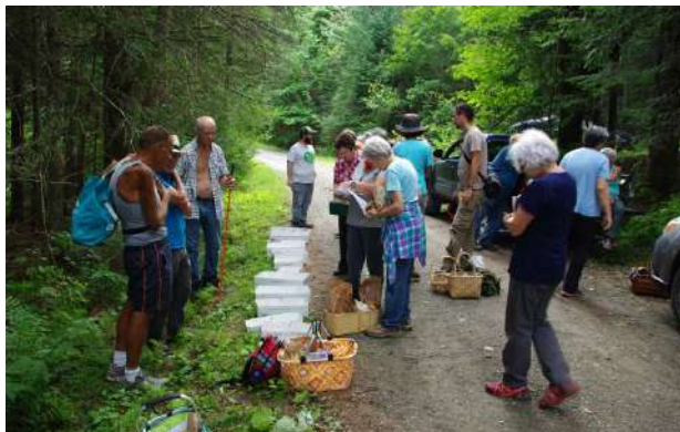
Figure 10 : Visite mycologique en août 2016.

Terminons en mentionnant que les activités récréotouristiques pratiquées dans la Forêt communautaire encouragent la pratique de l'activité physique et sont à la base de l'offre touristique des Trois Villages. En 2016-2017, l'industrie touristique a généré des retombées économiques directes de près de 50 M$ dans l'ensemble du territoire de la MRC de Coaticook 1 . Les infrastructures présentes à East Hereford et Saint-Herménégilde font partie de cette offre récréotouristique et ont vu une augmentation claire de leur achalandage en 2016-2017.