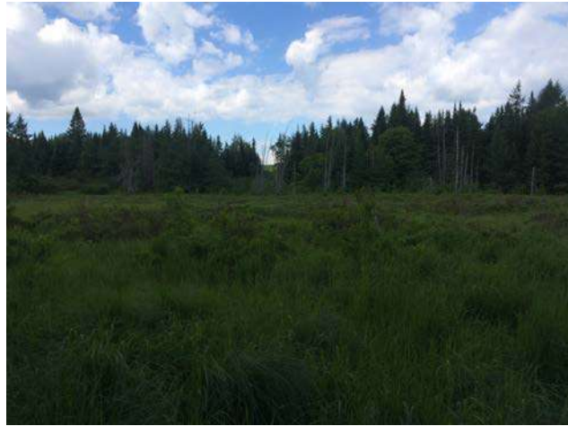
Figure 15 : Milieu humide visité par CNC en août 2016.