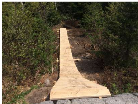
Figure 9 : Nouvelle rampe de départ du sentier de vélo la Maitrise