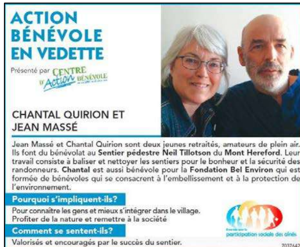
Figure 8 : Reconnaissance régionale de bénévoles impliqués dans l'entretien des sentiers pédestres dans la Forêt communautaire (mars 2017).