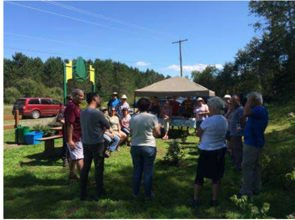
Figure 17 : journée portes ouvertes de la Forêt Hereford en août 2016