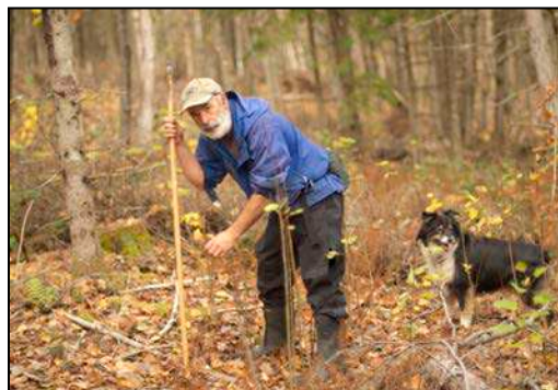
Figure 12 : Ensemencement de glands de chênes rouges en octobre 2016 par des bénévoles.

L'autre nouvelle approche implantée cette année consistait en l'ensemencement de glands de chênes rouges. Les bénévoles ont été grandement importants dans cette démarche que nous souhaitons refaire tous les ans, car ils ont fourni tant les glands que le temps pour les mettre en terre (figure 12).